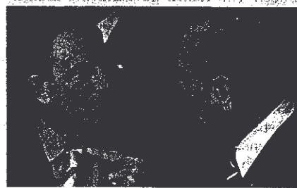
NEW DIVIDE: Subsidies for farmers versus jobs for Polish immigrants (top); Blair and Chirac

Thank you, Charles Crawford. The British ambassador to Poland recorded those very private thoughts in an e-mail, leaked in mid-December to the British press. OK, they were intended as a joke, a spoof speech for Prime Minister Tony Blair, but they nonetheless played to the core issue at the European Union's latest summit in Brussels. Its near failure to reach agreement on a new seven-year budget reveals a new East-West divide in Europe. On one side: a British faction keen to see the Union remodeled as a loose association of nation-states, devoted to revitalizing their economies but with limited funds and a Brussels bureaucracy kept firmly in check. On the other: the old-timers, most notably the French, wedded to the ideal of an ever-closer Union and such costly causes as protecting its farmers. In the middle: the newcomers from the